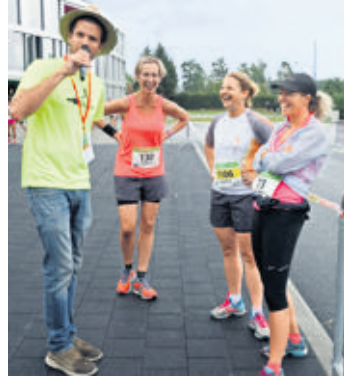
Sourires à l'interview d'avant-course, malgré la pluie.