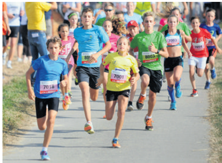
Départ pour les écoliers sous un soleil de plomb.